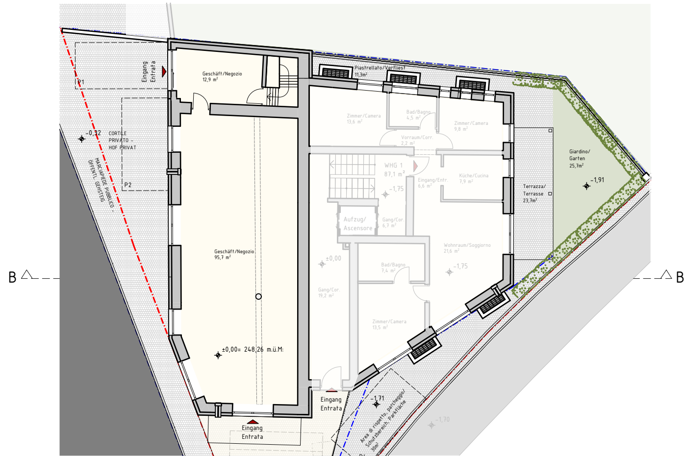
2. ERDGESCHOSS PIANO TERRA 1:200